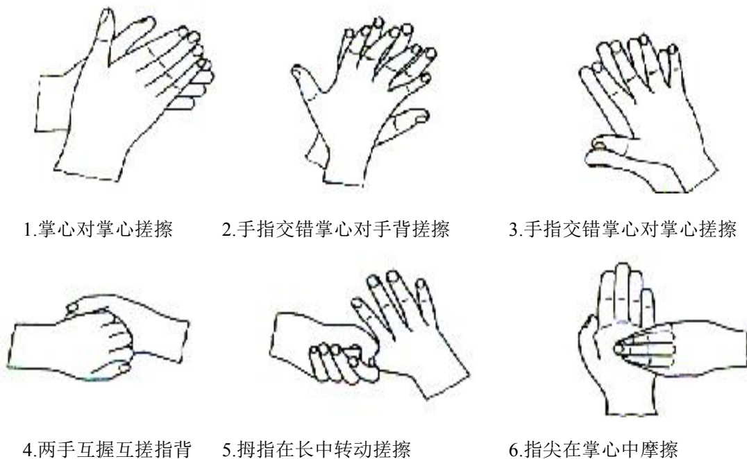
图2-1 标准的洗手方法

(9)参考样品组:对于卫生手消毒,取60%异丙醇3ml到入手心中,按标准的洗手方法用力搓擦30s。以确保手的所有部位均匀接触异丙醇。重复使用异丙醇按上述方法搓擦使总的搓擦时间为60s。对于外科手消毒,使用60%正丙醇3ml,按标准的洗手方法用力搓擦,当接近干燥时,再加3ml正丙醇搓擦。以保持作用3min。用流动的自来水冲洗5s,抖掉手上残留的水。其余步骤与试验样品组相同。